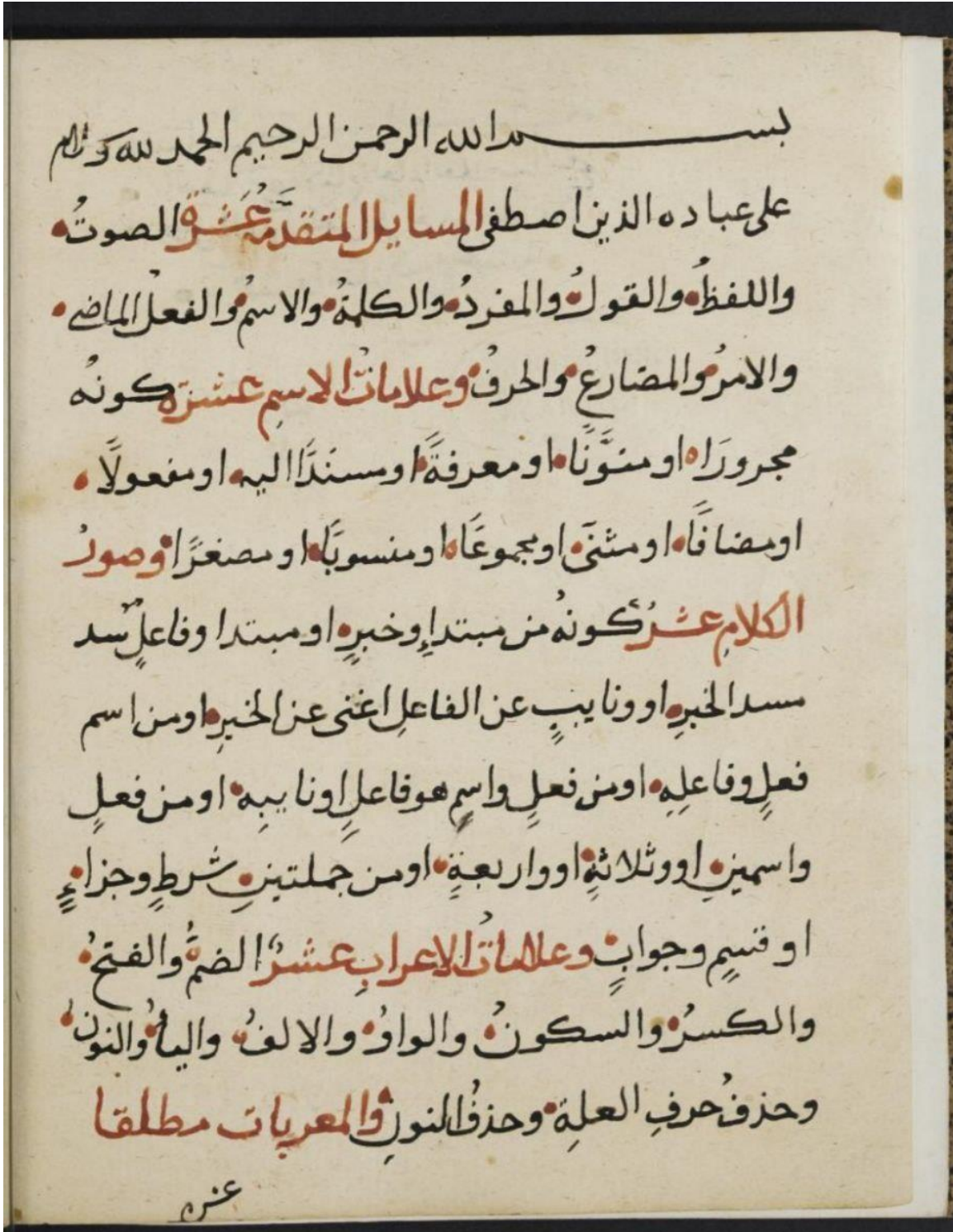
صورة اللوحة الأخيرة من المخطوط: